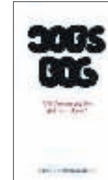
Jobs Bog. 183 sider. 300 kroner. Stauer Publishing.