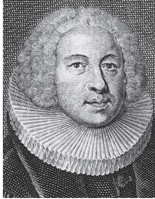
Salmedigteren Hans Adolph Brorson (1694-1764). Citatet er (med en mindre afvigelse) fra den niende strofe i Brorsons salme: "Op, al den ting, som Gud har gjort" (1734): "Hvad skal jeg sige? Mine ord / Vil ikke meget sige: / O Gud! hvor er din visdom stor, / Din godhed, kraft og rige!"

Hvorvidt et såkaldt æstetisk publikum har fundet, eller skulle kunne finde, nogen nydelse ved at læse eller ved