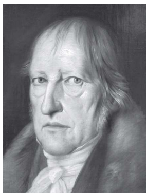
Filosoffen G.W.F. Hegel.