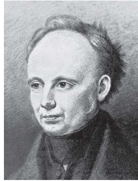
Den tyske forfatter Christian Dietrich Grabbe.

erkegaard også havde i sit bibliotek, og som han, efter alt at dømme, købte, da han var i Berlin i vinteren 1841-1842. Og her hos Hegel er det især afsnittet om “Om den dramatiske Poesi”, som Kierkegaard synes at have skrevet essayet om det tragiske i et med og modspil til.