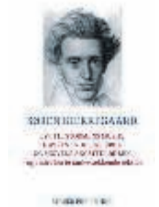
Søren Kierkegaard: Lyt til stormens musik, havets trodsige brøl og skovens angstfulde suk – og andre korte tankevækkende tekster. 230 sider. 300 kroner. Stauer Publishing.